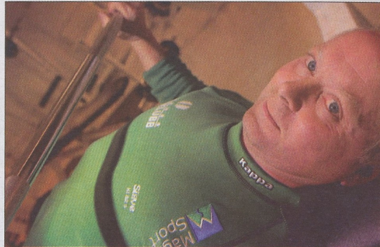
De siste forberedelser er gjort. Neste uke er det alvor.

– Gjør jeg det, blir det ny norsk rekord i vete-